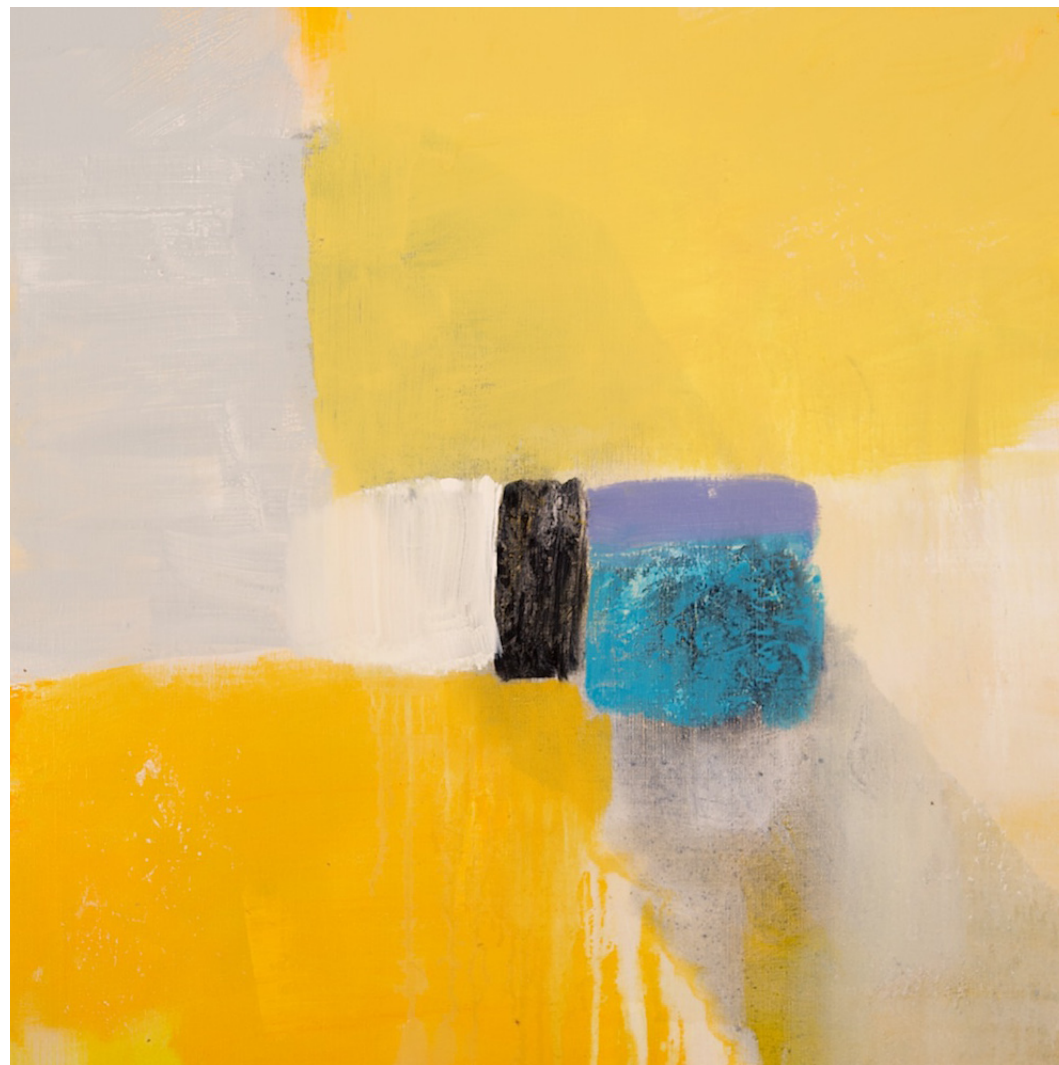
TITTEL | FORMAT | TEKNIKK