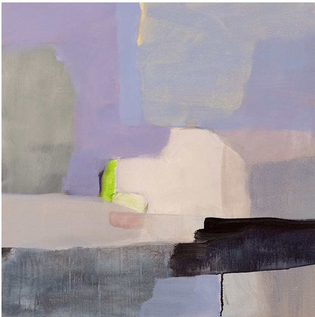
TITTEL | FORMAT | TEKNIKK