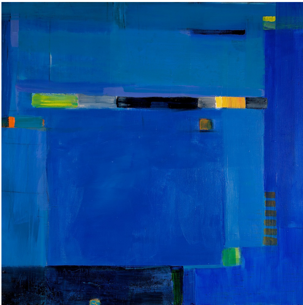
TITTEL | FORMAT | TEKNIKK