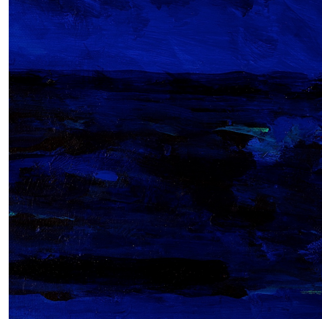
TITTEL | FORMAT | TEKNIKK