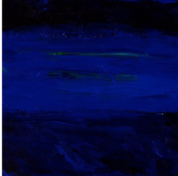
TITTEL | FORMAT | TEKNIKK