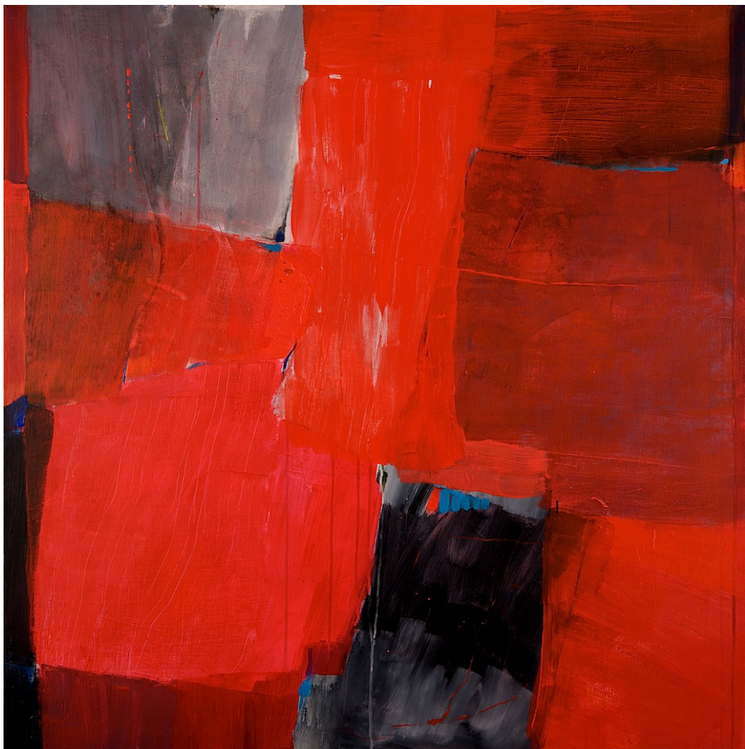
TITTEL | FORMAT | TEKNIKK