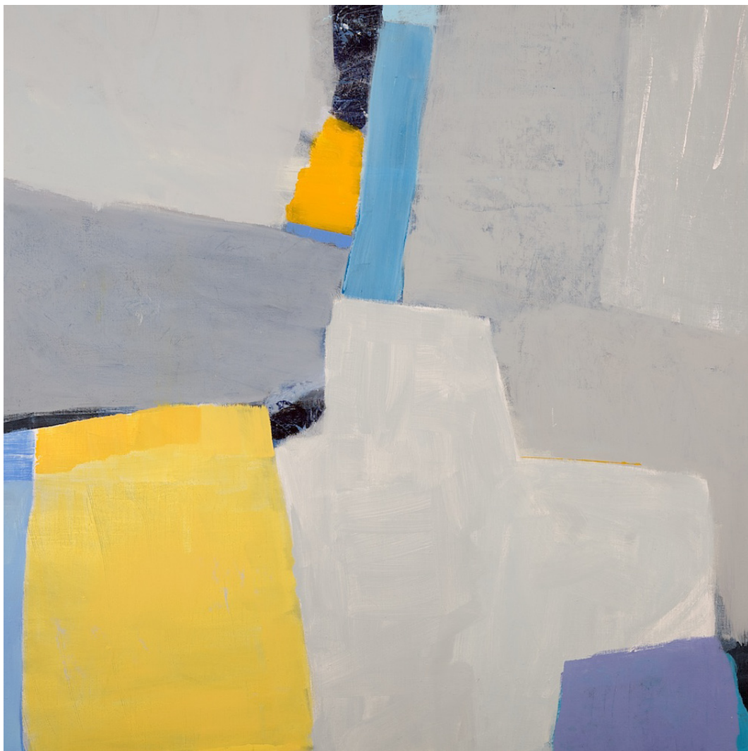
TITTEL | FORMAT | TEKNIKK