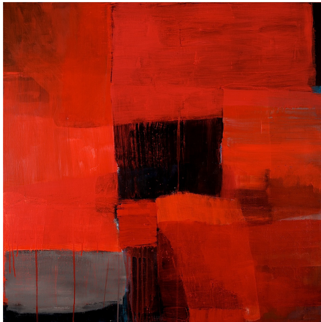
TITTEL | FORMAT | TEKNIKK